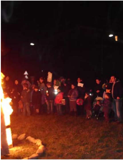
Martinsfeuer nach dem Umzug durch Fechenheim im Nordbezirk (links) und im Südbezirk.