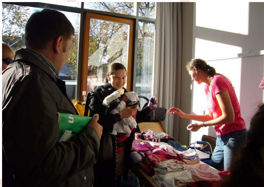
Ein Memoryspiel für die Kleinsten oder eine ungetragene Kapuzenjacke für Babys? Die Auswahl an günstiger Kinderkleidung und Spielzeug war riesengroß beim „Kinderflohmarkt“ am 6. November im Melanchthon-Gemeindehaus. Und zahlreiche Mütter und Väter nutzten die Schnäppchen-Gelegenheit bei Kaffee und Kuchen gerne.